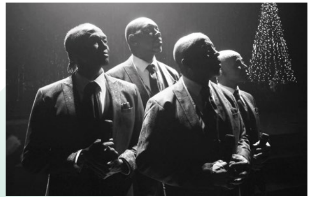
Motown goes Christmas