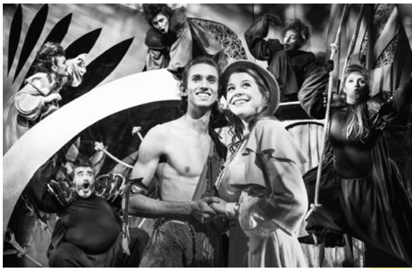
Tarzan – das Musical