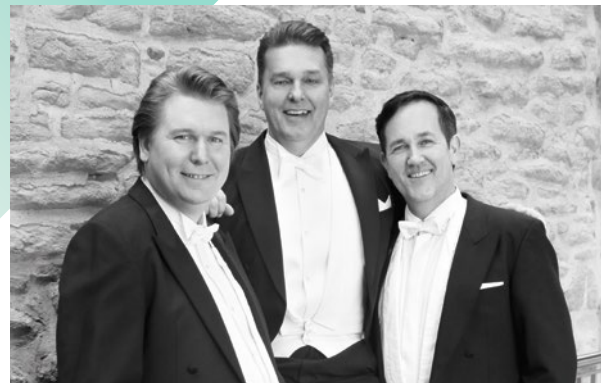
Die drei Tenöre

Zwei Paare, ein Haus: Die Rotemunds – er Zahnarzt, sie Hausfrau – haben die letzten zwanzig Jahre sehr gern hier gelebt, doch jetzt sind die Kinder ausgezogen und schweren Herzens trennen sie sich von ihrem Eigentum, um in eine kleinere Wohnung umzuziehen. Die jungen Lindners – sie Anwältin, er Finanzberater und noch kinderlos – scheinen die idealen Nachfolger:innen zu sein. Beim Anstoßen auf die Vertragsunterzeichnung gerät die Konversation zunehmend in Schiefelage und nimmt eine interessante Wendung.