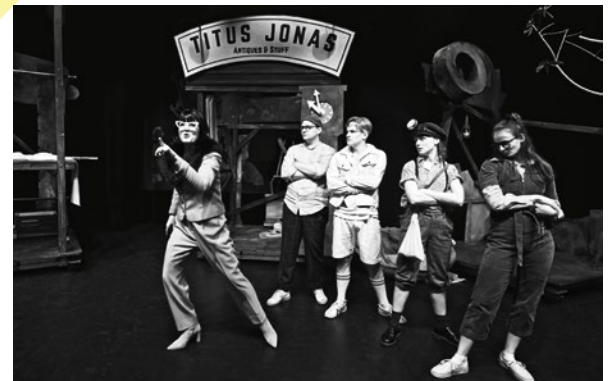
Die drei ???

Unser Titelheld nimmt Groß und Klein mit auf ein atemberaubendes Abenteuer in den afrikanischen Dschungel! Wir erzählen die hundert Jahre alte Geschichte von Edgar Rice Burroughs neu: Das Theater Liberi inszenierte, mit spektakulären Eigenkompositionen, jeder Menge Spannung und einem Hauch Romantik ein Musical zu einem Live-Erlebnis für die ganze Familie.