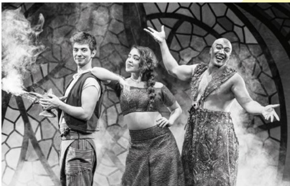
Aladin – das Musical / © Theater Liberi