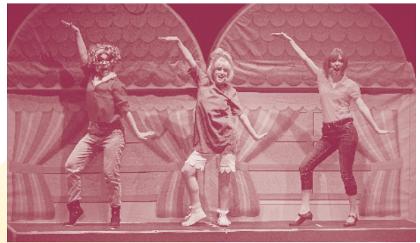
Bibi Blocksberg

Tom hat es nicht leicht. Im Wohnzimmer ärgert ihn seine eingebildete Schwester und im Keller hockt ein schleimiges