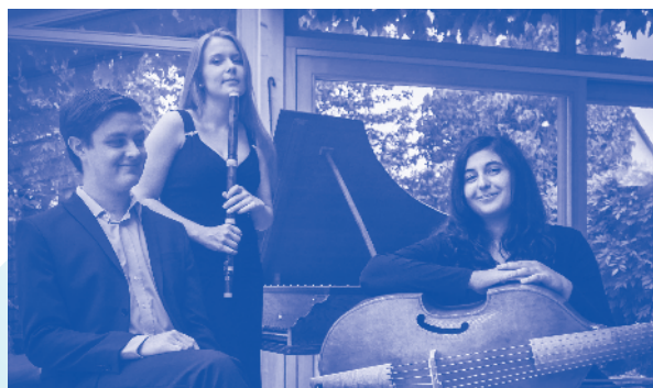
La Réjouissance

Schauspiel nach dem Roman von Khaled Hosseini Amir und Hassan wachsen auf wie Brüder, obwohl sie im Kabul der 1970er aus unterschiedlichen Welten kommen: der eine reich, der andere arm. Ihre Freundschaft wird auf die Probe gestellt als Amir Hassan in den Rücken fällt. Ihre beiden Leben nehmen einen völlig diametralen Verlauf. Amir flüchtet mit sei- ner Familie in die USA. Hassan und seine Frau werden von den Taliban getötet. Ihr Sohn kommt ins Waisenhaus. Dann kehrt Amir zurück um seine Schuld zu begleichen. Die ergreifende Geschichte nach dem erfolgreichen Roman und bekannten Film inszeniert vom Westfälischen Landestheater.