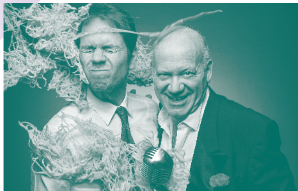
Eros & Ramazotti

Mit seinen unerschöpflichen melodischen Einfällen und bezaubernden orchestralen Farben, in der Atmosphäre changierend, traf Lehár den Nerv der damaligen Zeit. Die satirisch-exotisch-pikant-boulevardeske Geschichte präsentiert von der Konzertdirektion Schmitdke in drei Akten. Sonderpreis ab 35,90 € + Gebühren im Vorverkauf!