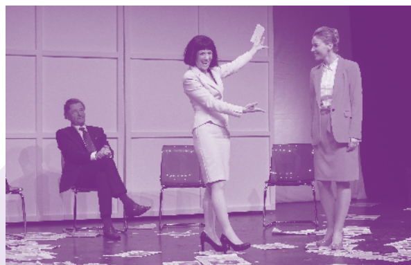
Mr. President First

Packender Krimi nach dem Roman von Volker Kutscher Berlin, 1935. Die zunehmend beklemmende gesellschaftliche Atmosphäre ist geprägt von Denunziationen. Sich dagegen zu behaupten ist der Schlüssel zum Überleben. Das Westfälische Landestheater inszeniert Kutschers jüngsten Roman über den Oberkommissar Gereon Rath und seinen Rivalen Johann Marlow. Kutschers Romane wurden die Vorlage zur Fernsehserie »Babylon Berlin« und machten ihn zu einem der erfolgreichsten Krimiautoren.